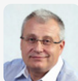
JIŘÍ NOUZA prezident, Svaz podnikatelů ve stavebnictví