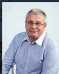
Jiří Nouza prezident Svaz podnikatelů ve stavebnictví